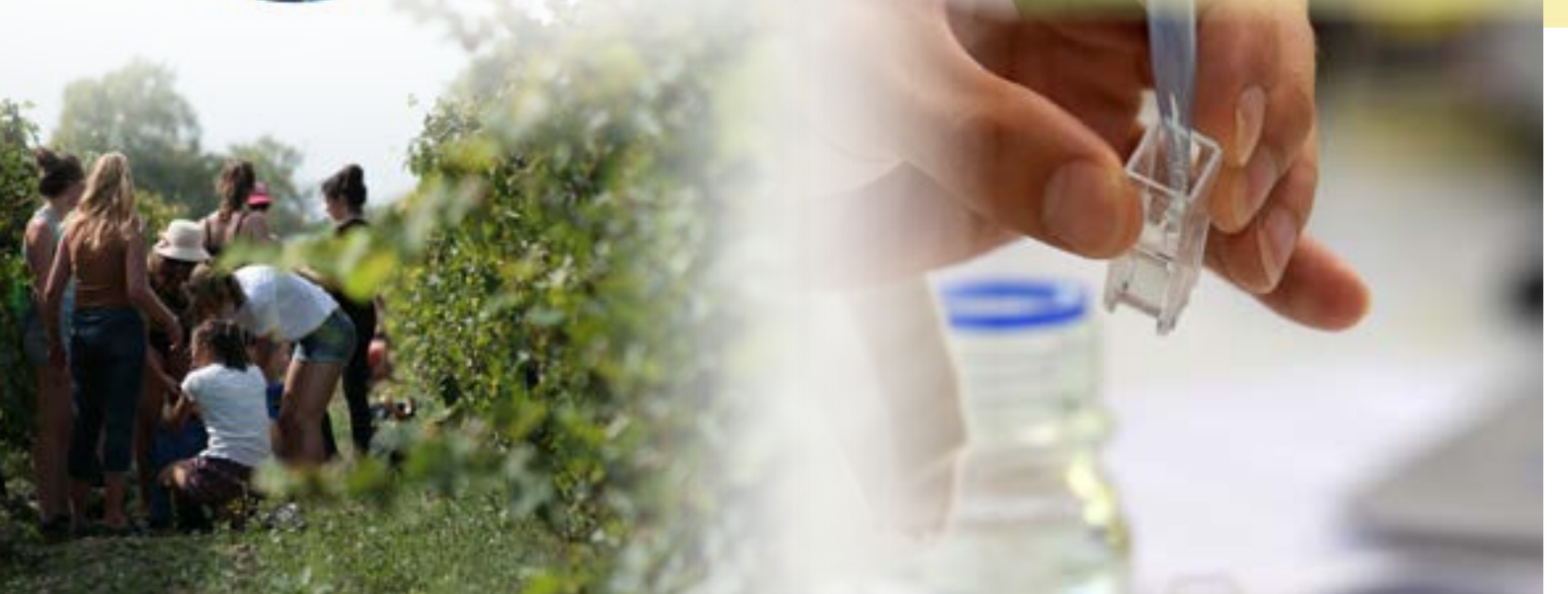
Illustration : Manon Sauzara

Activités de conseil Services Enseignement